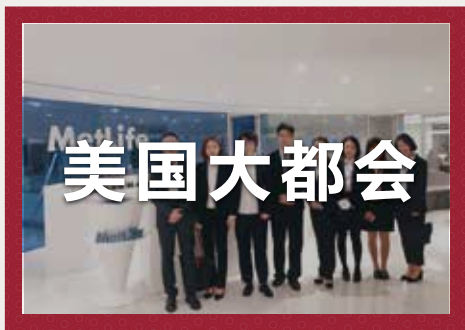
美国大都会集团 财富五百强第114位--标准普尔: A+

作为香港本土顶尖的金融企业，毕业后想去香港读研和工作的小伙伴，也可以选择这个企业的实习。安达的7天实习，主要是以劳逸结合为主，导师们都会带小伙伴们出去一边玩一边学，小伙伴们的实习反馈都是非常高的。安达实习期间，公司位于香港购物中心 铜锣湾。公司周围就有 soho 百货，各种品牌应有尽有，小伙伴结束一天辛苦的实习，可以好好犒劳自己。