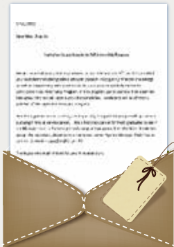
五百强企业高层个人推荐信