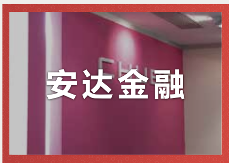
安达金融集团 国际顶尖金融集团 标准普尔: AA- 级

成立已经超过200年的加拿大宏利金融集团，也是IBEP项目热门实习企业之一，小伙伴们想要在宏利大展拳脚也是非常具有挑战性的哦，宏利有着严格的企业规章制度和管理理念。同学们要是进入这个企业，一定要严格要求自己，提升自身素养，而且要多和小组导师沟通交流，才能学到更多机会去提升自己呢！