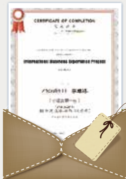
五百强企业项目完成证书