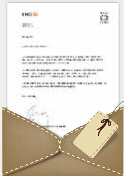
五百强企业管培生邀请函