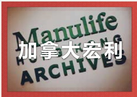
加拿大宏利金融集团 加拿大第1位, 北美第2位

宏利金融是加拿大主要的财经服务企业，业务遍布全球19个国家和地区，继2004年完成加拿大历史上最大一宗跨国合并交易，成功实施对美国 John Hancock恒康金融服务有限公司的合并。